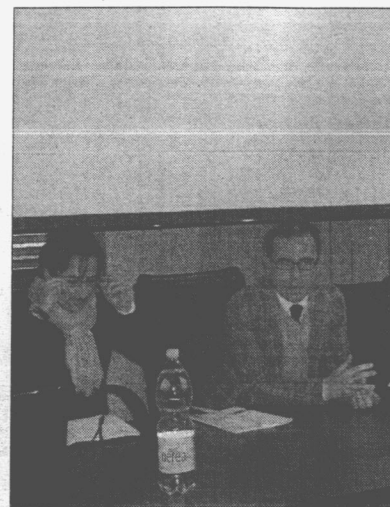
Due dei relatori e a sinistra gli operatori